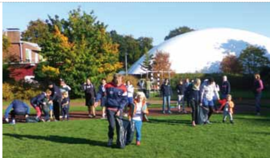
Unser Ufo ist gelandet und fesgetackert.