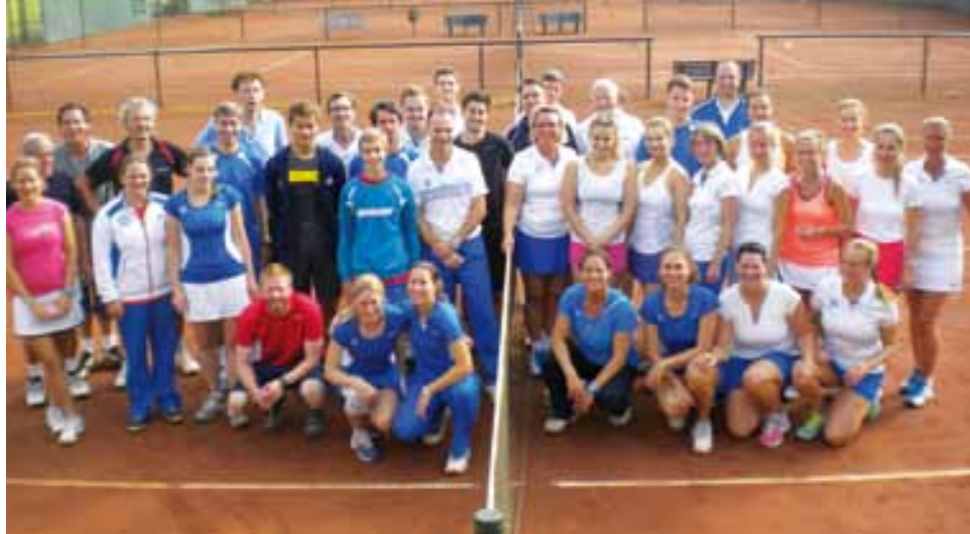
Pro Am. Ein munteres Aufeinandertreffen von Profis und Amateuren