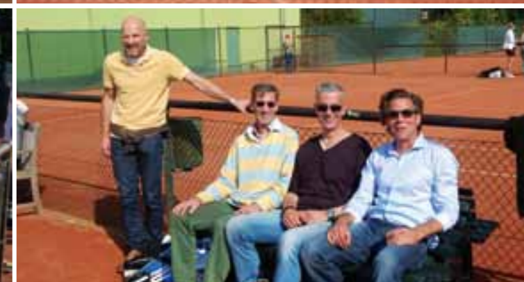
Gute Stimmung unter den Zuschauern und bei der Siegerehrung