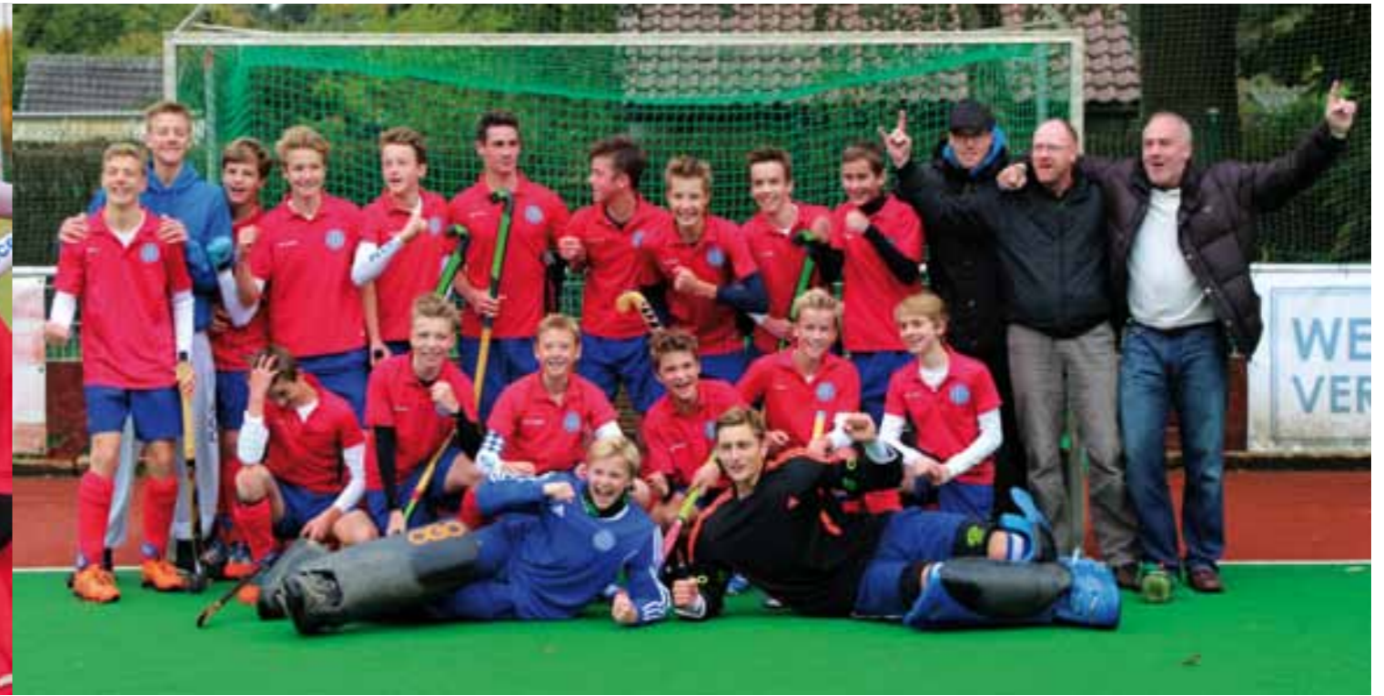
Gemeinsam haben sie es mit fast 70 Schlachtenbummlern: Familien, Freunde und Fans bis nach Düsseldorf, zur Deutschen Meisterschaft und einem tollen 3.Platz gebracht!