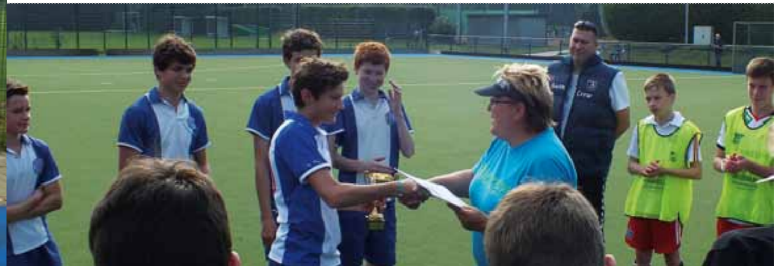
Übergabe der Urkunde an das stolze Team